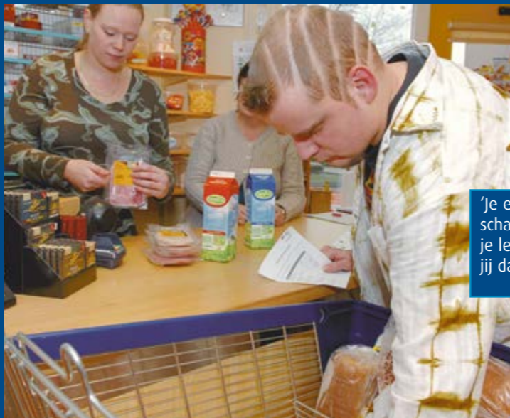
'Je eigen boodschappen doen en je leven leiden zoals jij dat wilt.'