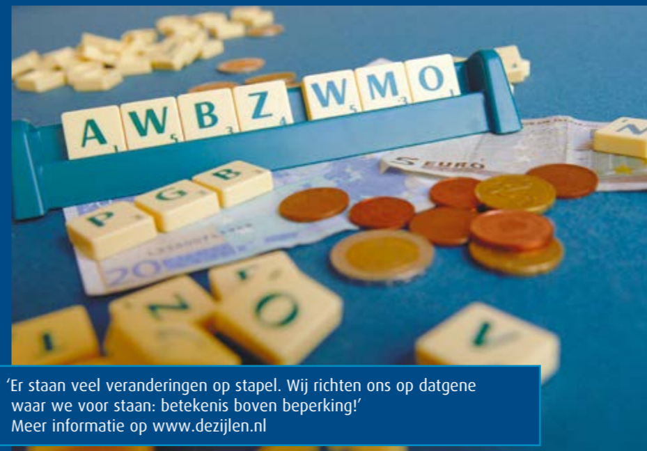
'Er staan veel veranderingen op stapel. Wij richten ons op datgene waar we voor staan: betekenis boven beperking!' Meer informatie op www.dezijlen.nl