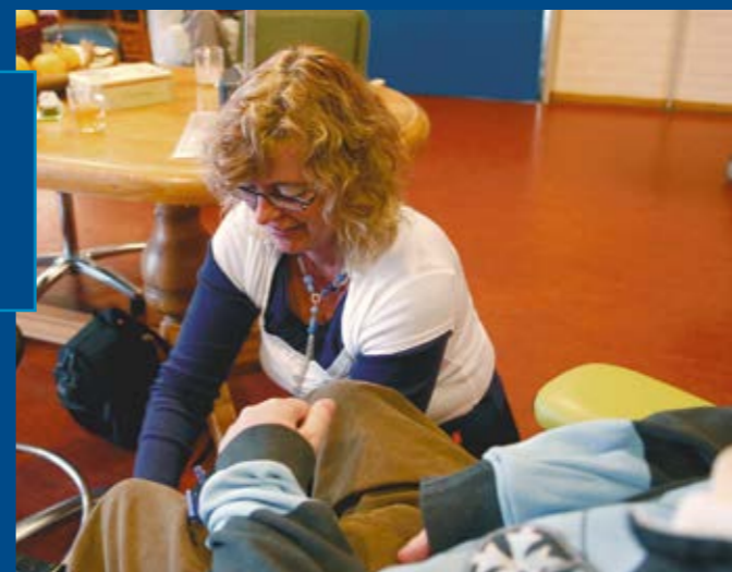
'Medewerkers van De Zijlen spijkeren steeds hun kennis bij om uitstekende zorg en ondersteuning te kunnen verlenen.'