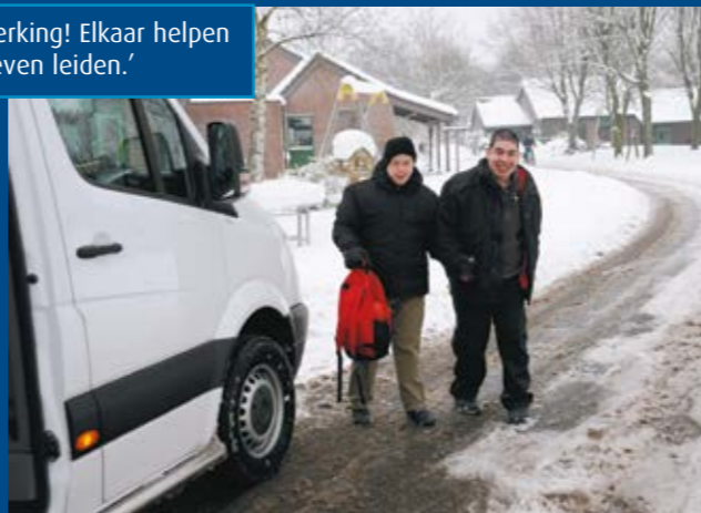
'Betekenis boven beperking! Elkaar helpen en samen een goed leven leiden.'