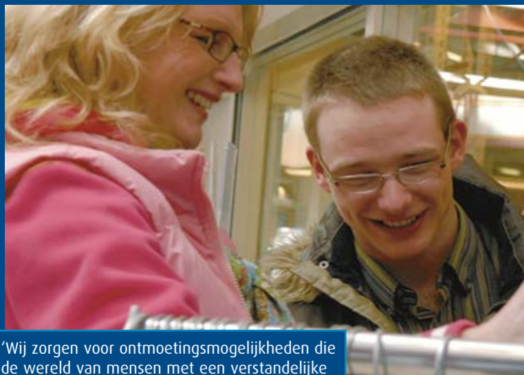
'Wij zorgen voor ontmoetingsmogelijkheden die de wereld van mensen met een verstandelijke beperking vergroten.'