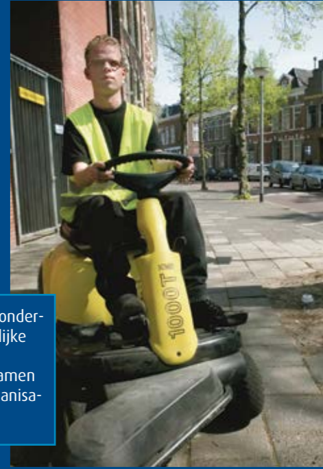
'We hebben al jarenlang ervaring in het ondersteunen van mensen met een verstandelijke beperking die een plek zoeken in de samenleving. We werken hierbij graag samen met gemeenten, welzijnsaanbieders, organisaties en bedrijfsleven.'